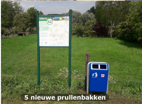
5 nieuwe prullenbakken