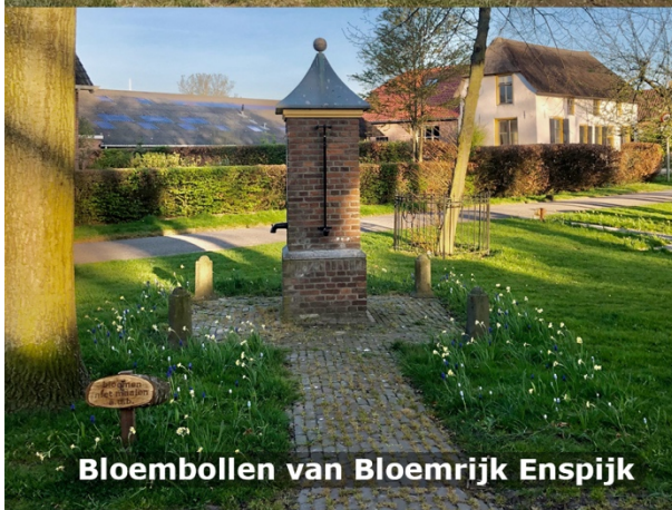
Bloembollen van Bloemrijk Enspijk