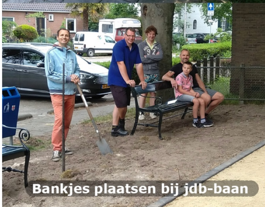
Bankjes plaatsen bij jdb-baan