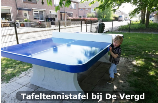
Tafeltennistafel bij De Vergd