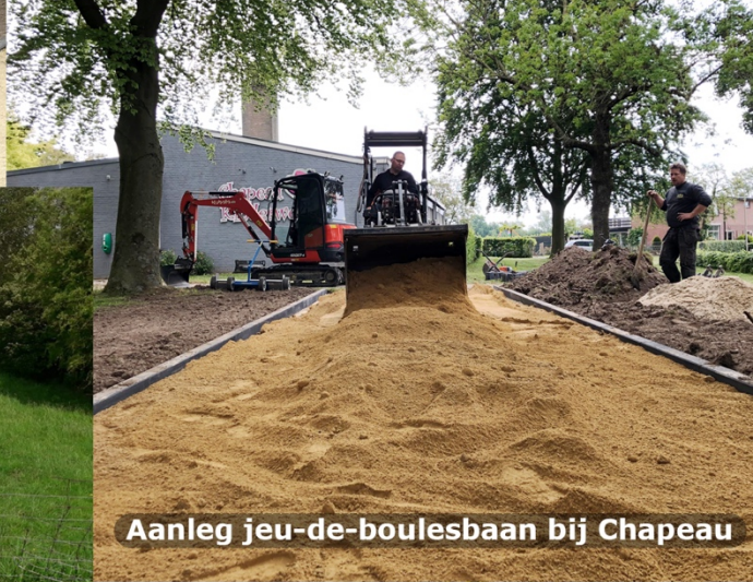
Aanleg jeu-de-boulesbaan bij Chapeau