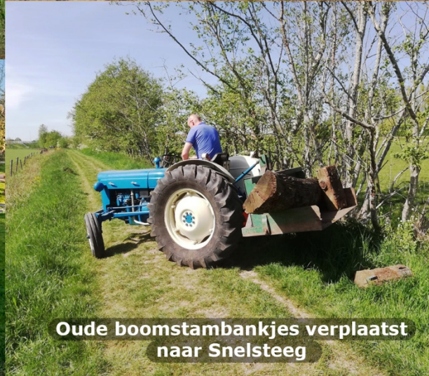
Oude boomstambankjes verplaatst naar Snelsteeg